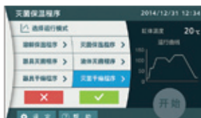
运行模式选择（灭菌干燥程序）