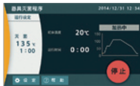
器具灭菌程序运转