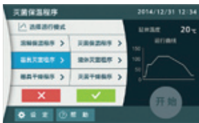
运行模式选择（器具灭菌程序）