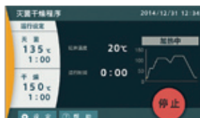
灭菌干燥程序运转